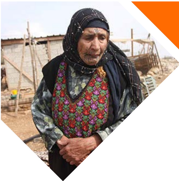
Una dona d'una comunitat beduïna de peu enmig de les ruïnes de sa casa en Jabaa, Cisjordània. 2011

El 7 de juliol de 2014 , Israel llançava sobre Gaza l'operació militar denominada Marge Protector . Durant 50 dies, es va desenvolupar una devastadora ofensiva per terra, mar i aire, que va produir un elevat nombre de morts i una destrucció massiva de llars i infraestructures civils (com la central elèctrica i el sistema d'aigua i sanejament) sense precedents a la Franja de Gaza, almenys des de l'ocupació de 1967 .