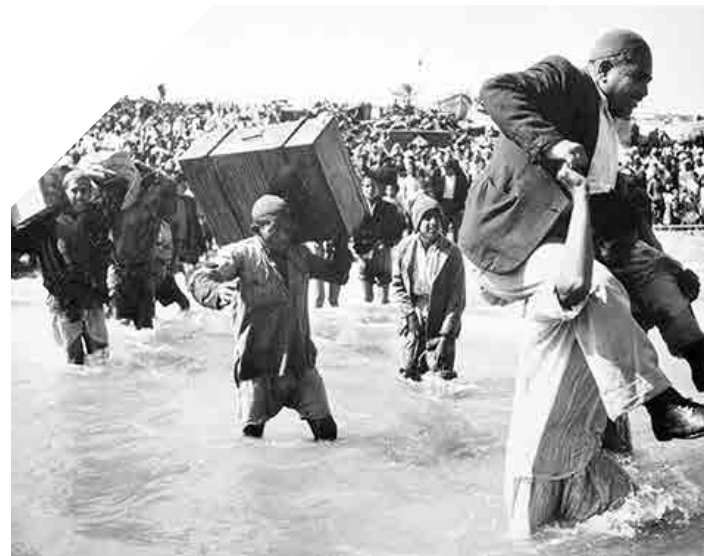
Els refugiats i refugiades de Palestina inicialment desplaçats al Beach Camp en la Franja de Gaza en prenen botes a la cerca d'una millor vida a Líban o Egipte. 1949.

No obstant açò, des de 1967, l'estat d'Israel incomplirà de manera sistemàtica les seues obligacions com a potència ocupant en virtut del Dret Internacional Humanitari.