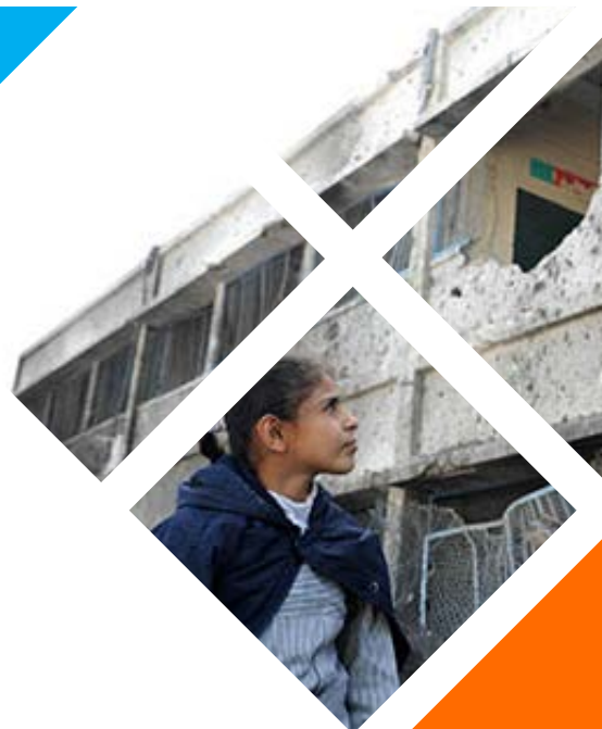
Una xiqueta en un edifici destruït a Gaza 2012

En novembre de 2012 va tenir lloc l'ofensiva militar israeliana Pilar Defensiu . Durant 8 dies, la Franja va ser atacada per aire, mar i amb tancs, la qual cosa va afeblir encara més les seues infraestructures. Com a conseqüència, 12.000 palestins i palestines van ser desplaçats temporalment, 1.700 cases van ser destruïdes o seriosament danyades, i milers d'elles van patir danys menors. Va haver-hi 158 morts i 1.269 ferits.