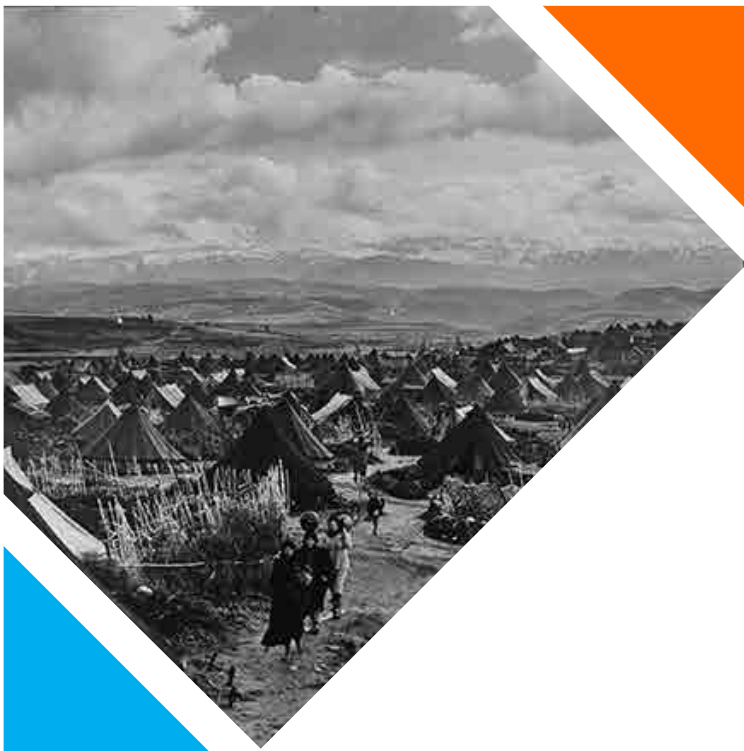
Nahr el Bared, en Líban va ser un dels primers camps establerts com a part de les mesures d'emergència per a abrigar els refugiats de Palestina. Principis dels anys 1950.

Finalitzada la guerra, la població palestina s'enfronta a una forta crisi humanitària agreujada pel desplaçament de més de 700.000 persones. A partir d'aleshores commemorem la Nakba, terme àrab que significa "catàstrofe" utilitzat per a designar l'èxode massiu palestí. Milers de palestins van haver de fugir a altres països veïns (Jordània, Síria i Líban, principalment) o refugiar-se en altres ciutats o poblacions situades en el que hui coneixem com a territori Palestí ocupat (Cisjordània, incloent-hi Jerusalem Est, i la Franja de Gaza), i van perdre les seues llars i els seus mitjans de vida. Aquestes persones i els seus descendents van passar a ser persones refugiades de Palestina.