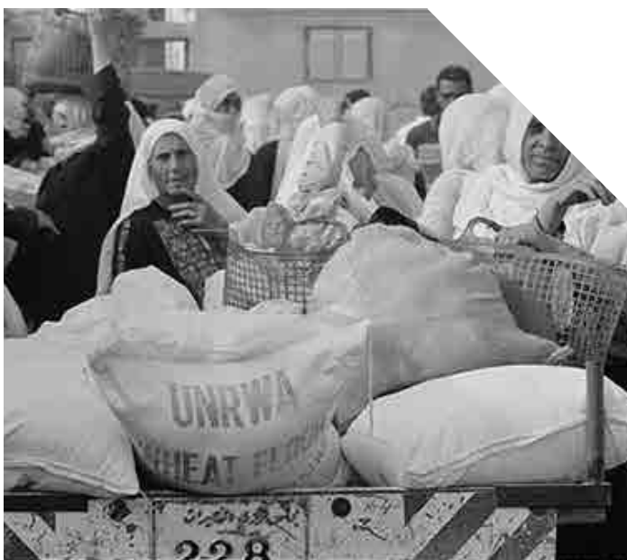
Punt de distribució alimentària en Beach camp, Gaza. 1989.

La violència va decaure en 1991 i va finalitzar amb la signatura dels Acords d'Oslo (13 de setembre de 1993).