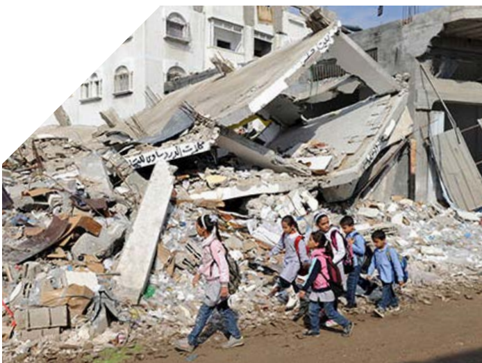
Un grup de xiquets camina cap a l'escola a Gaza. 2012

Si no s'acaba el bloqueig, es calcula que es tardarà més de 20 anys a reconstruir la Franja de Gaza. La reconstrucció del teixit social necessitarà més temps a causa dels centenars de famílies destruïdes i del fet que les persones supervivents estan seriosament traumatitzades. Els més de 2.000 morts han deixat 1.500 xiquets i xiquetes orfes d'un o ambdós pares, i molts ancians s'han quedat sols. El nombre de dones d'entre 60 i 69 anys vídues és del 40%, elevant-se fins el 90% entre les dones de més de 80 anys. S'estima que el 10% de les persones ferides durant aquesta ofensiva quedarà amb alguna discapacitat física per a tota la vida (30% d'ells, xiquets i xiquetes).