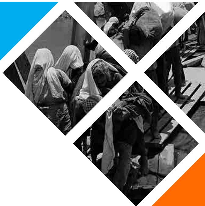
Els refugiats de Palestina escapen a través del Pont d'Allenby durant les hostilitats de 1967. Aproximadament 400.000 palestins/es van creuar el riu Jordà fugint del segon conflicte àrab-israelià. 1967.

El 22 de novembre de 1967 el Consell de Seguretat aprova la resolució 242 que afirma que per al compliment del mandat de l'ONU es requereix la instauració d'una pau justa i duradora a l'Orient Mitjà, que passa per la retirada de l'exèrcit israelià dels territoris ocupats durant el recent conflicte i el respecte i reconeixement de la sobirania i la integritat territorial i la independència política de cada Estat de la regió, i el seu dret a viure en pau a l'interior de fronteres reconegudes i segures, a l'abric d'amenaçes i actes de força.