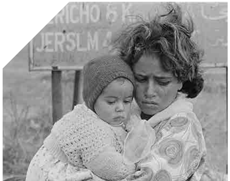
Una xiqueta refugiada en el Pont d'Allenby, a 8km de Jericó i 43km de Jerusalem. Molts refugiats de Palestina van escapar per segona vegada després de les hostilitats de 1967. 1967.

Al setembre de 1982 té lloc la massacre en els campaments de Sabra i Shatila. Les milícies libaneses cristianes irrompen en els camps de refugiats i assassinen centenars de palestins desarmats durant la guerra del Líban. Segons la Comissió Kahan, l'exèrcit israelià apostat al Líban va ser indirectament responsable dels fets per no evitar les matances. Aquesta massacre va merèixer la qualificació d'acte de genocidi per part de l'Assemblea General a través de la seua resolució 37/123.