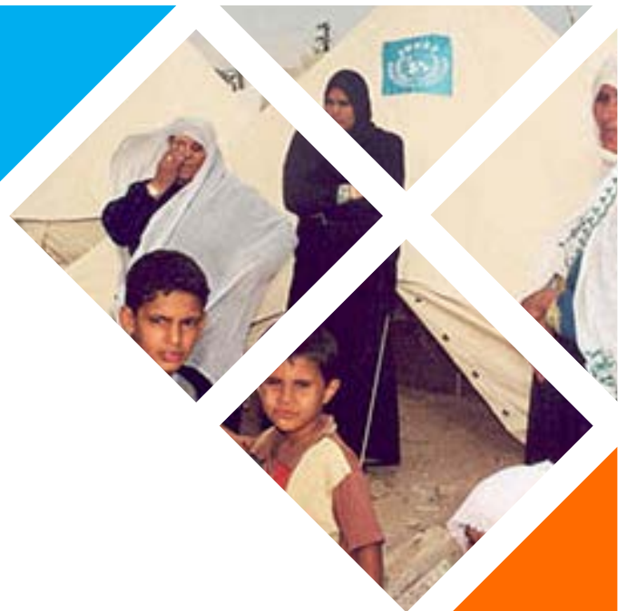
Campament Khan Younis durant la segona intifada. 2001.

Al setembre de l'any 2000 , en ple debat sobre el futur de Jerusalem, Ariel Sharon, cap de l'oposició israeliana en aquell moment, visita l'Esplanada de la Roca i la Mesquita d'Al-Aqsa amb el permís de la seguretat palestina. Aquest gest es percep com una gravíssima provocació i va ser el detonant de la tensió acumulada per l'ocupació israeliana.