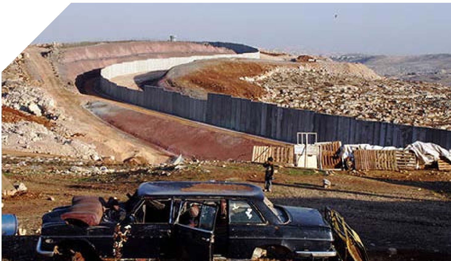
Mur de Cisjordània. 2006

El mur s’estén aproximadament en un 20% al llarg de l’antiga Línia Verda, la de les fronteres de 1948, i el 80% restant en territori cisjordà més enllà de la Línia, endinsant-s’hi fins a 22 quilòmetres en alguns llocs, amb la finalitat d’incloure assentaments israelians densament poblats com, entre altres, Ariel, Gush Etzion, Emmanuel, Karnei Shomron, Guiv’at Ze’ev, Oranit i Maale Adumim.