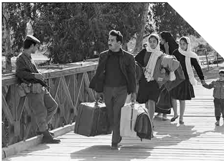
Refugiats creuen un nou pont temporal a través del riu Jordà, prop del Pont d'Allenby destruït després de les hostilitats de 1967. Sense data.

En la Resolució 3236 (XXIX) del 22 de novembre de 1974 de l'Assemblea General de Nacions Unides es reafirmen els drets inalienables del poble palestí (lliure determinació, independència, sobirania nacional, el retorn de la població refugiada a les seues llars, etc.).