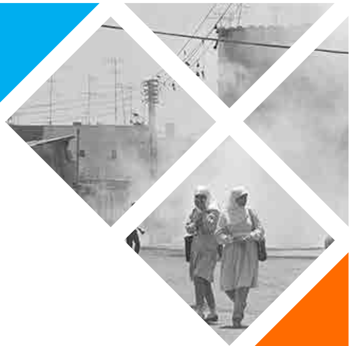
Escena del carrer a la Franja de Gaza durant la primera intifada. 1988.

La Intifada de 1987 transcorre del 9 de desembre de 1987 al 13 de setembre de 1993, i s'estén per tot el territori palestí. Aquesta Intifada va arribar a ser coneguda com la "guerra de les pedres".