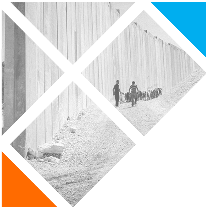
Conduint un ramat de cabres al llarg del Mur de Cisjordània, prop de la Muntanya dels Oliveres, Jerusalem. Sense data.

Al·legant el “principi d’autodefensa” a causa dels atacs suïcides, el 23 de juny de 2002 Israel inicia la construcció del mur. La seua estructura consisteix en un sistema de tanques i filats al llarg d’aproximadament el 90% del seu traçat, mentre que en el 10% restant adopta la forma d’un mur de formigó prefabricat d’entre 8 i 9 metres d’altura, creat amb mòduls individuals disposats un al costat de l’altre, i intercalats cada certs intervals amb torretes per al control militar.