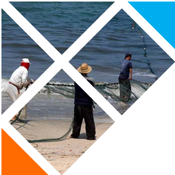
Pescadors de Rafah, Gaza. 2009

Fins a l'any 2005, l'estat d'Israel mantenia una ocupació física sobre la franja de Gaza, tal com manté ara sobre Cisjordània, incloent-hi la presència de l'exèrcit, assentaments de colons i altres mesures de pressió i control a l'interior de la Franja. L'any 2005, Ariel Sharon va ordenar el desmantellament dels assentaments, va retirar l'exèrcit i va donar pas a una ocupació efectiva a través del control de l'espai aeri, marítim i terrestre, i un bloqueig socioeconòmic que segueix vigent en l'actualitat.