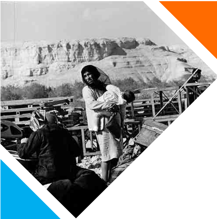
Un nou pont temporal per a reemplaçar el destruït Pont d'Allenby permet a les famílies refugiades poder continuar creuant el riu Jordà. Sense data.

En 1982 esclata la primera guerra entre el Líban i Israel. El conflicte armat es va iniciar el 6 de juny de 1982 quan l'exèrcit israelià va envair el sud del Líban amb l'objectiu d'expulsar l'Organització per a l'Alliberament de Palestina (OLP) d'aquest país. El govern d'Israel va ordenar la invasió com a resposta a l'intent d'assassinat de l'ambaixador israelià al Regne Unit, Shlomo Argov, per part del grup d'Abu Nidal.