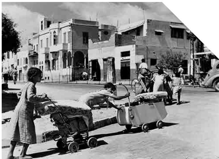
Unes xiquetes espenten les seues pertinences en cotxets mentres deixen Jaffa. 1948.

El final de la guerra arriba després de diversos intents de mediació per part de Nacions Unides que, entre febrer i juliol de 1949, aconseguen un acord d'armistici entre Israel, Egipte, Síria, Jordània i Líban com a pas previ a la pau. Els Acords d'Armistici de 1949 delimitaran la frontera entre el territori que passarà a ser l'estat d'Israel i els territoris palestins administrats per Jordània i Egipte, frontera que des d'aquell moment es va a conèixer com la Línia Verda. Israel havia ocupat com a resultat de la guerra la major part de Palestina, a excepció de la ribera occidental del riu Jordà (Cisjordània), que passarà a estar ocupada per la legió àrab de Jordània, i la Franja de Gaza, que serà administrada per Egipte.