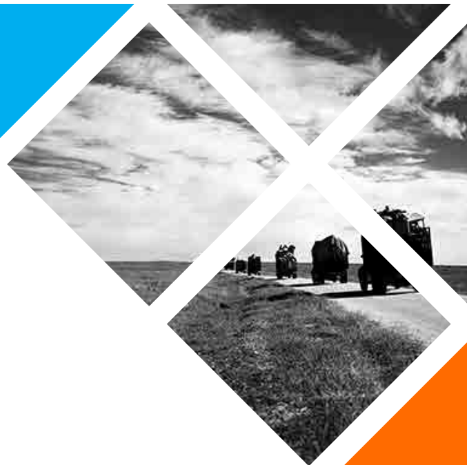
Un comboi de camions porta a refugiats/des i les seues pertinences de la Franja de Gaza a Hebron a Cisjordània. Desembre de 1949.

“ha de permetre's als refugiats que ho desitgen tornar a les seues llars el més prompte possible i viure en pau amb els seus veïns, i s'han de pagar indemnitzacions a títol de compensació per els béns d'aquells que decidisquen no tornar a les seues llars i per tots els béns que hagen sigut perduts o danyats, en virtut dels principis del dret internacional o en equitat, aquesta pèrdua o aquest dany ha de ser reparat pels governs o autoritats responsables.”