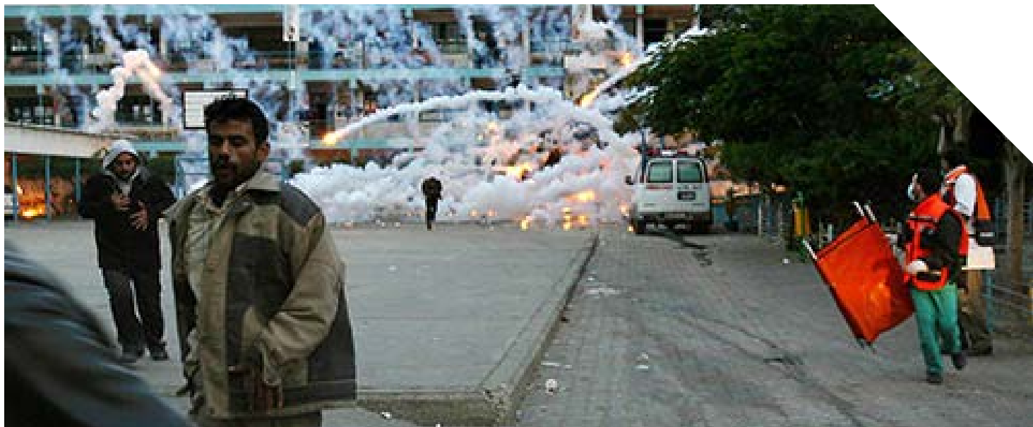
Bombes de fòsfor blanc cauen sobre instal·lacions d'UNRWA en Beit Lahiya. 2009.