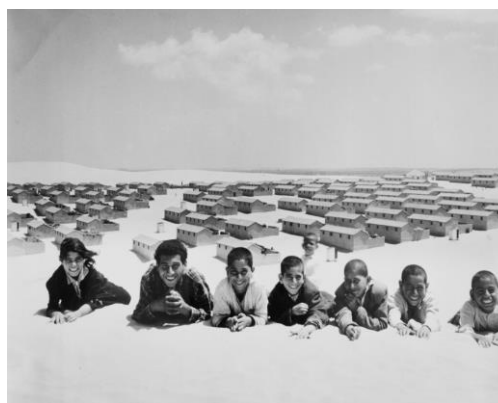
Foto 1: El Pueblo Al- Falouja en evacuación. 1949

UNRWA comienza sus operaciones en mayo de 1950. Su prioridad fue la distribución de alimentos, que incluían artículos básicos como harina, arroz, queso y jabón, así como ofrecer cobijo a la población refugiada que en un primer momento se alojaba en tiendas de campaña en los campos de refugiados y que posteriormente fueron reemplazadas por albergues prefabricados o viviendas de bloques de hormigón.