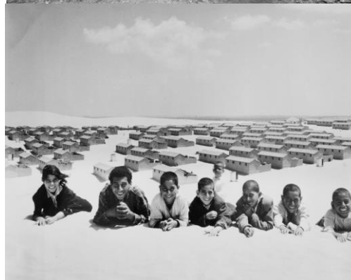
Foto 1: El Poble Al-Falouja en evacuació. 1949. © Arxiu de Nacions Unides / Fotògraf desconegut..