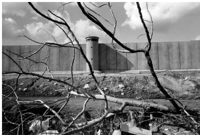
Foto 6: Vista del Muro en Qalqilya, Cisjordania. 2003

Israel comienza la construcción del Muro en 2002, que separa a numerosas familias de sus comunidades, familiares y sus tierras de cultivo, para cuyo acceso tienen que solicitar permisos, muy difíciles de conseguir. La ocupación efectiva de la Franja de Gaza por Israel a través del control del espacio aéreo, marítimo y terrestre, y el bloqueo socioeconómico tiene enormes repercusiones económicas y sociales. En el año 2000, unas 80.000 personas necesitaban ayuda alimentaria de UNRWA. En la actualidad UNRWA distribuye alimentos a 876.000 personas.