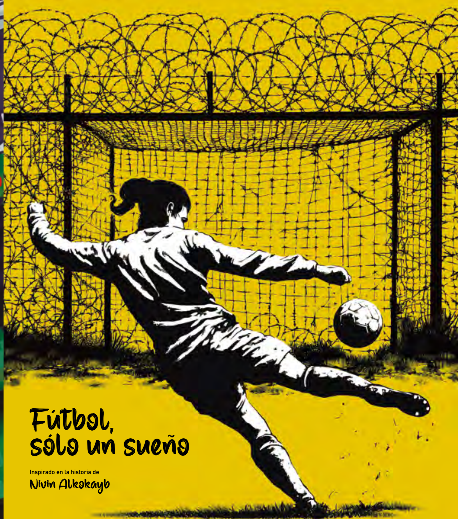
Ilustración: Laura García Baello

El estruendo de las bombas sólo podía ser silenciado por el sonido de los pinceles sobre el lienzo desnudo, los tonos cálidos de las pinturas me abrazaban, trasportándome a un lugar seguro.