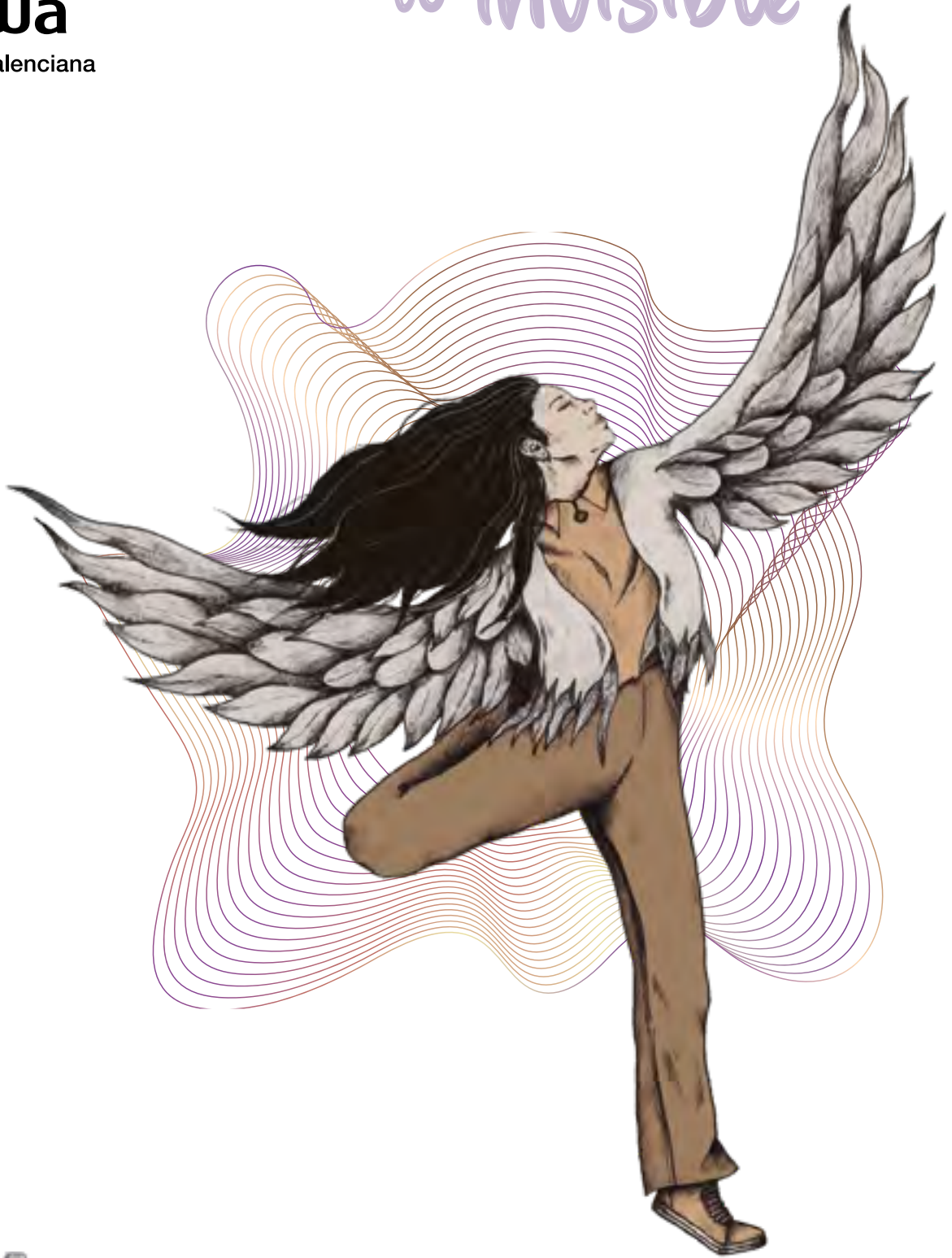
Ilustración: Clara Alegre del Hierro