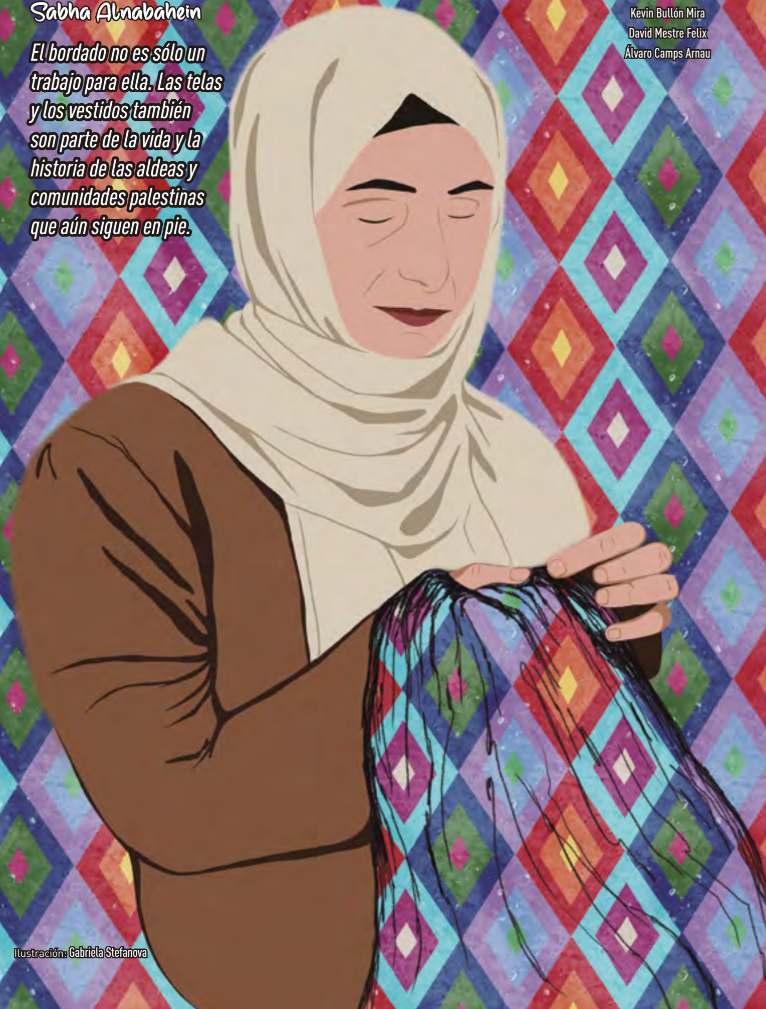
Ilustración: Gabriela Stefanova

El bordado no es sólo un trabajo para ella. Las telas y los vestidos también son parte de la vida y la historia de las aldeas y comunidades palestinas que aún siguen en pie.