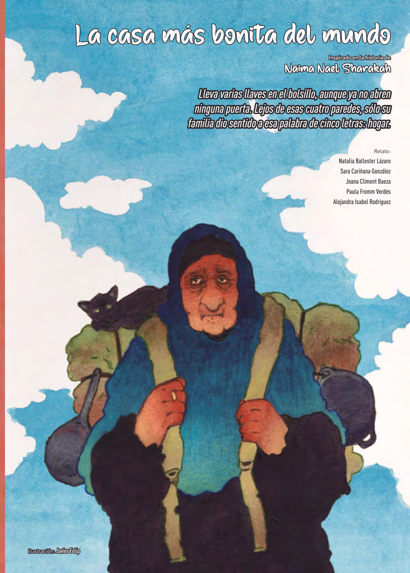
Ilustración: Javier Felip