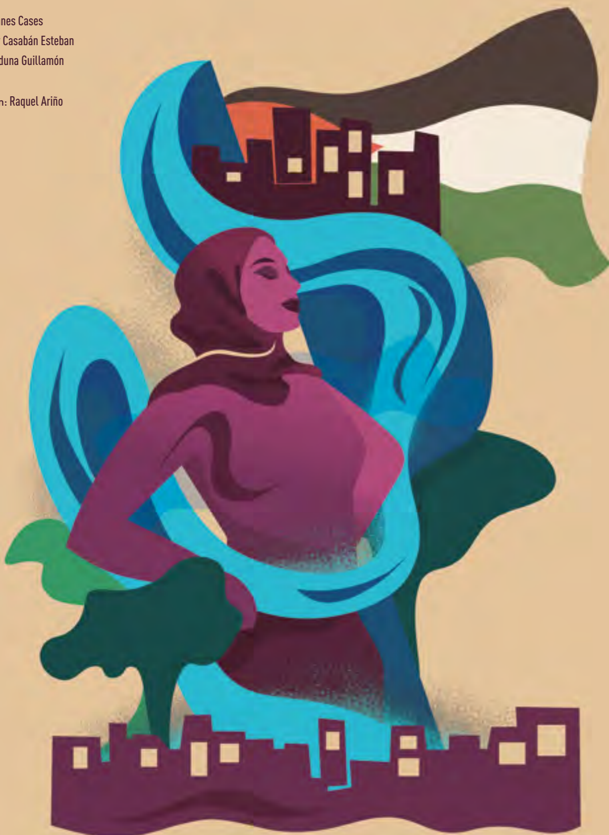
Ilustración: Raquel Ariño

Creció rodeada de manantiales, tomó el camino del cuidado medioambiental y hoy es un ejemplo de lucha.