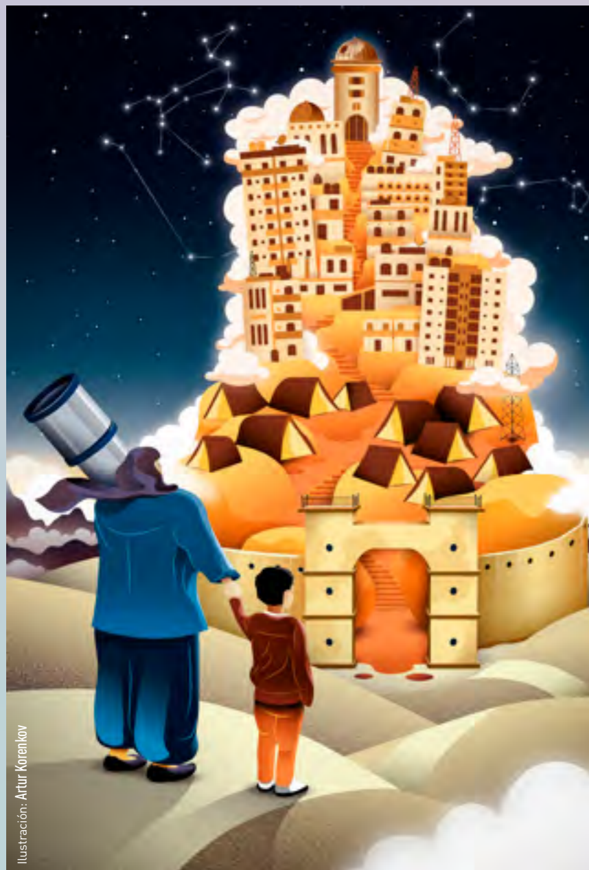
Ilustración: Artur Korenkov

Puedes conocer todas las historias y más información en: eventos.unrwa.es/visibilizando-lo-invisible